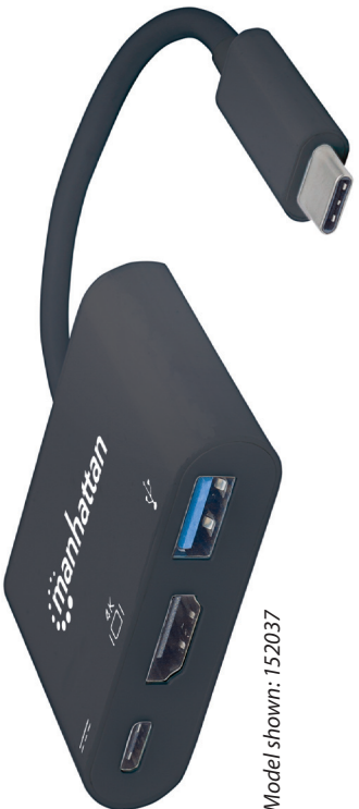
Model shown: 152037